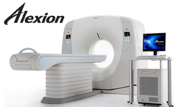
東芝メディカルシステムズ株式会社製 Alexion TSA-032A 16列マルチスライスCT

撮影速度は胸部全体をおよそ10秒前後で撮影可能で、息止めの困難な高齢者の方に対しても短時間で撮影ができるため、従来よりも負担が少ない検査が可能になるとともに、動きの影響を抑えた高品質の画像を提供いたします。