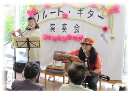
オレンジマーマレードのお二人