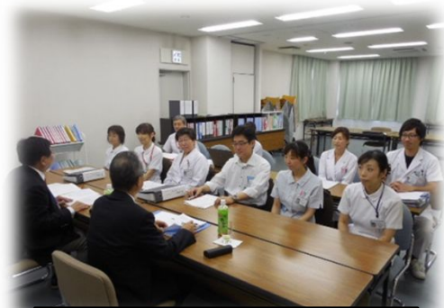
人間ドック健診施設機能評価 面接風景