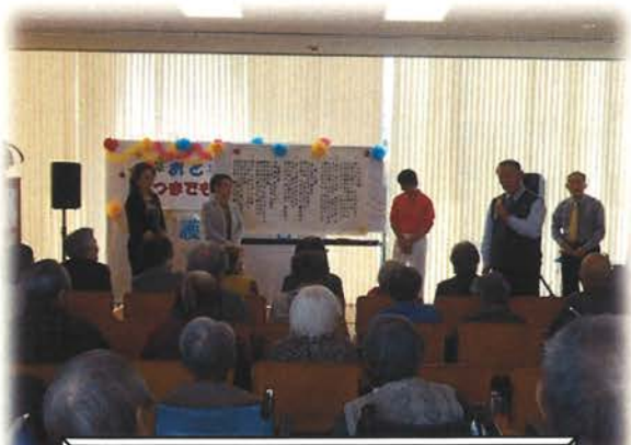
「おとずれ会」のみなさま