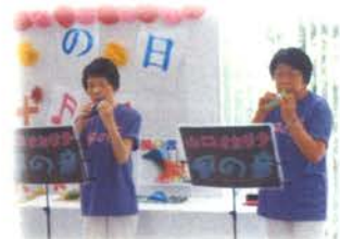
山口オカリナ「風の音」のみなさま