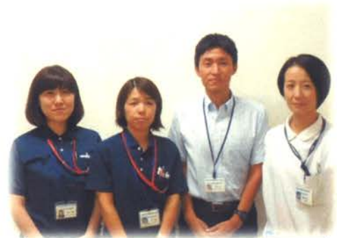
地域医療連携室のスタッフです。

昔のことになりますが、大学卒業後は下関市でソーシャルワーカー、ケアマネジャーの仕事をしていました。結婚して山口市に住むようになり、その後は社会福祉法人等で仕事をしていました。病院に勤めるのは初めてですが、患者様が抱える不安を少しでも軽くできるよう、また様々な関係機関と患者様のつながりを作っていくよう努めていきたい、という気持ちです。どうぞよろしくお願いいたします。