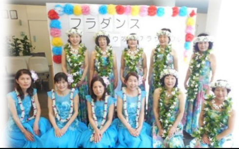
ハウオリフラサークルのみなさま