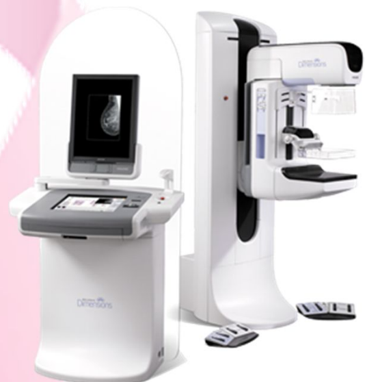
日立メディコ(HOLOGIC)社製