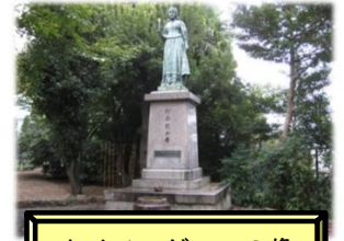
ナイチンゲールの像