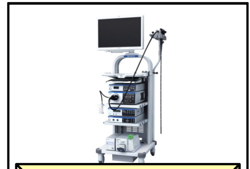
オリンパス株式会社製 内視鏡ビデオスコープシステム EVIS LUCERA ELITE