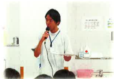
講演・実技中の 理学療法士・作業療法士