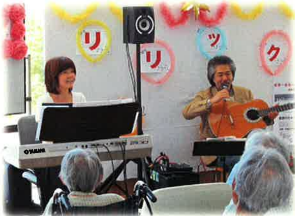
インストゥルメンタル・ユニット リリック のお二人