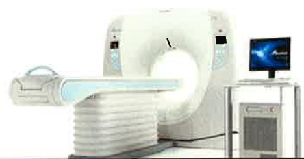
東芝メディカルシステムズ株式会社製 Alexion TSA-032A 16列マルチスライスCT