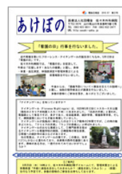
あけぼの【第22号】 2010年7月発行 PDF677KB