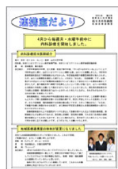
連携室だより【第22号】 2010年6月発行 PDF190KB