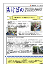
あけぼの [第22号] 2010年7月発行 PDF677KB